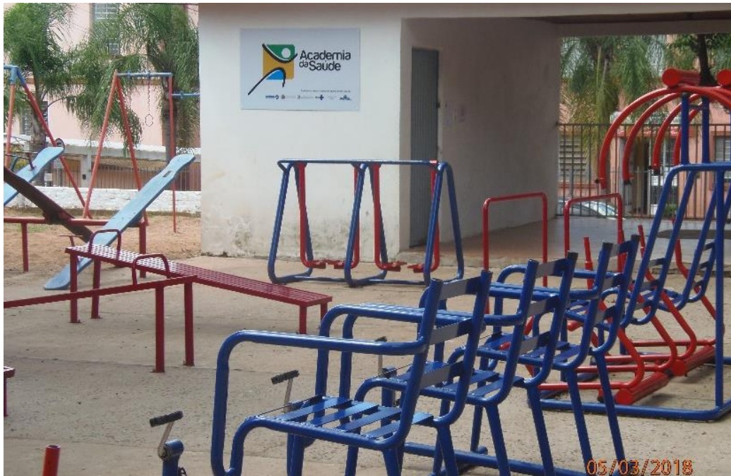
Reforma na academia de saúde do polo da Praça Santo Papa João Paulo II