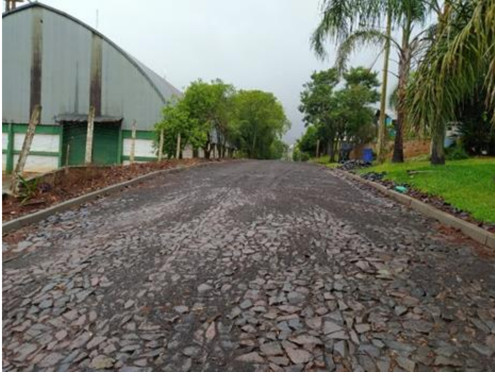
Calçamento da Rua dos Imigrantes (entre a Rua Ijuí e a área verde – Esperança II)