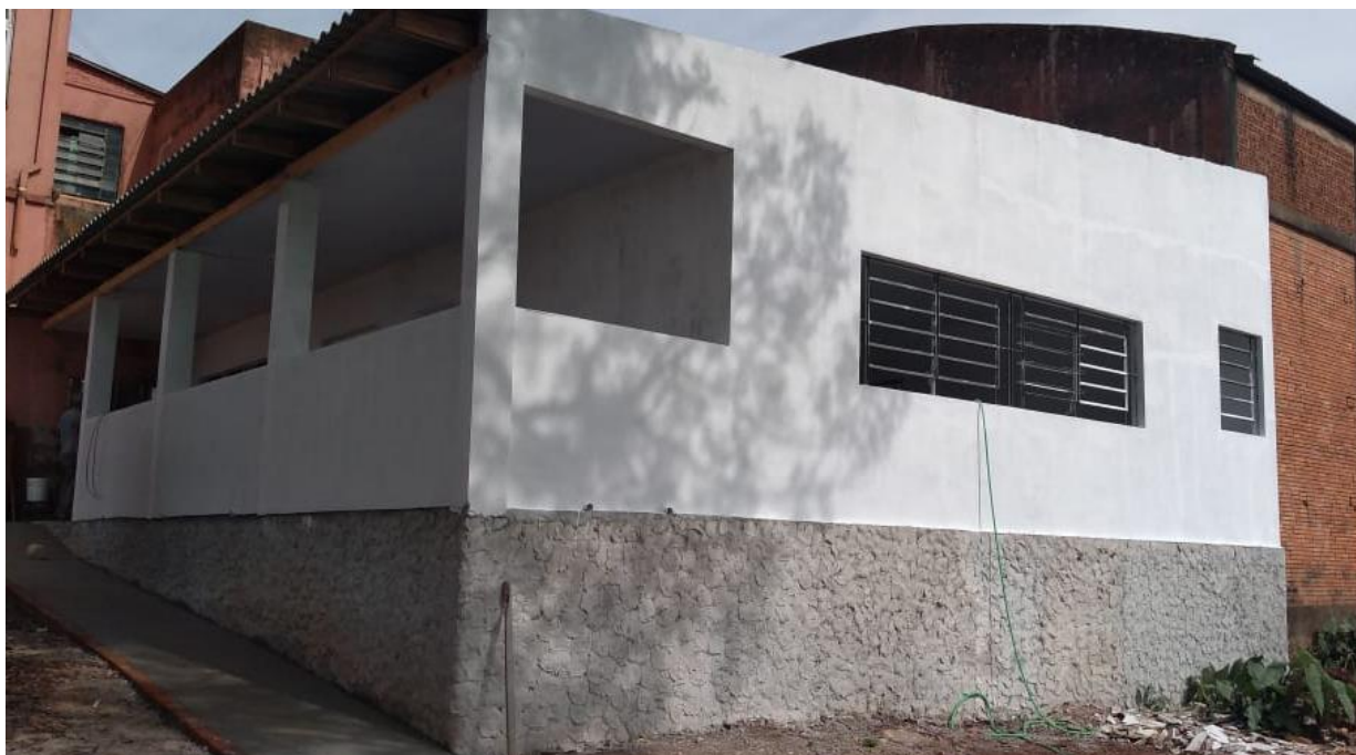
Pintura da Escola São José

Escola Municipal de Ensino Fundamental São José – readequação das salas de aulas, pintura e construção de nova cozinha e refeitório, com área total de 129,92 m 2 , no valor de R$ 106.076,12 (cento e seis mil, setenta e seis reais e doze centavos).