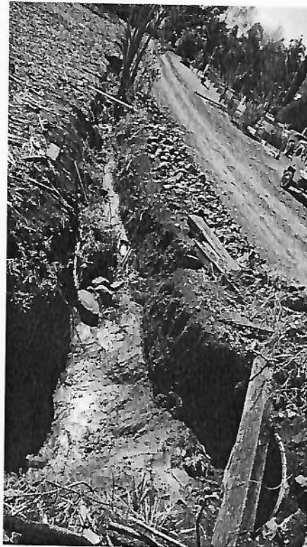
Foto 09 – Deságue em rede existente (Rua Orestes Arruda da Silva)